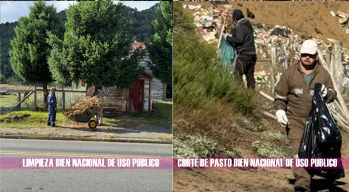
LIMPIEZA BIEN NACIONAL DE USO PUBLICO CORTE DE PASTO BIEN NACIONAL DE USO PUBLICO