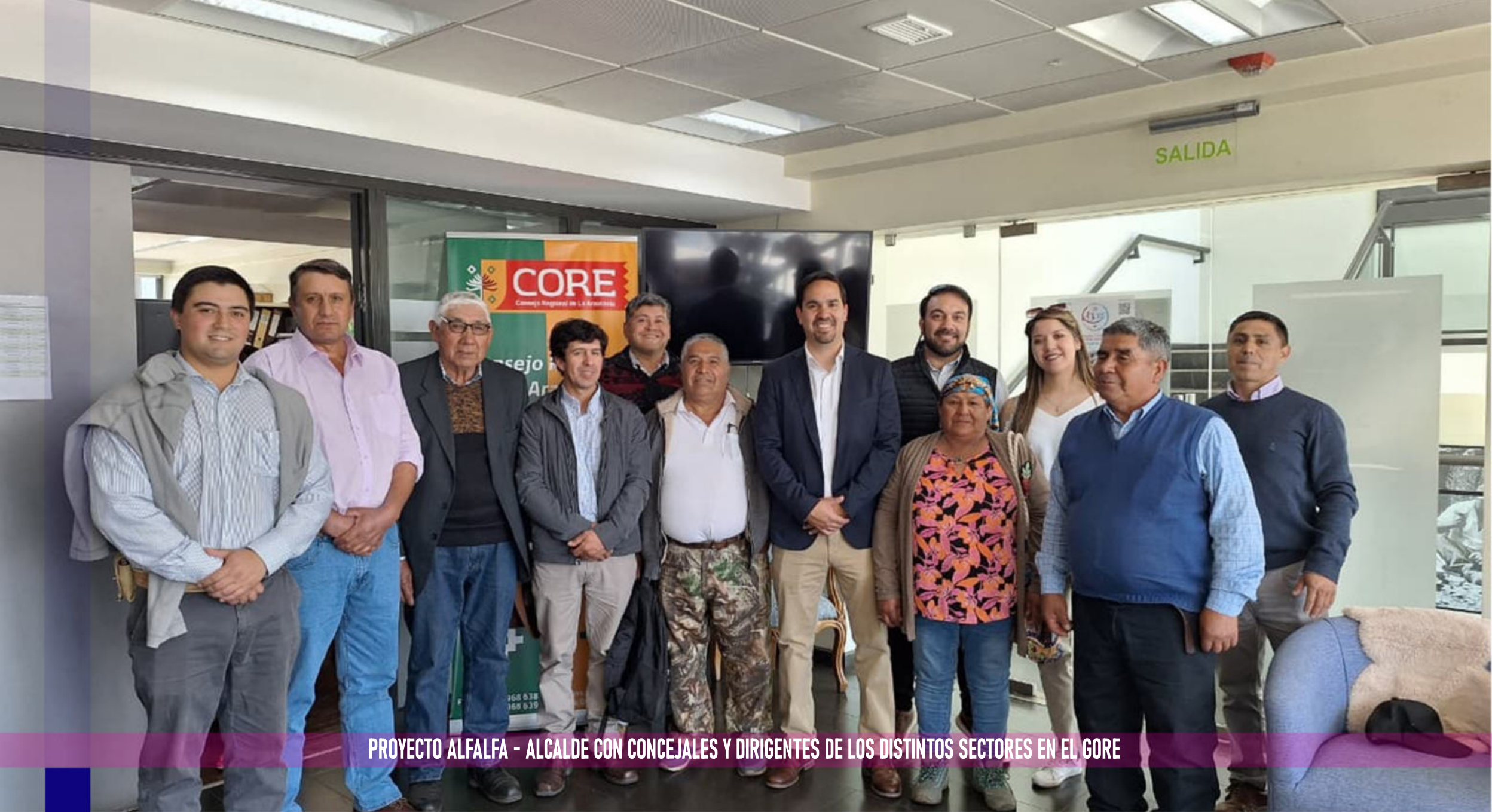
PROYECTO ALFALFA - ALCALDE CON CONCEJALES Y DIRIGENTES DE LOS DISTINTOS SECTORES EN EL GORE