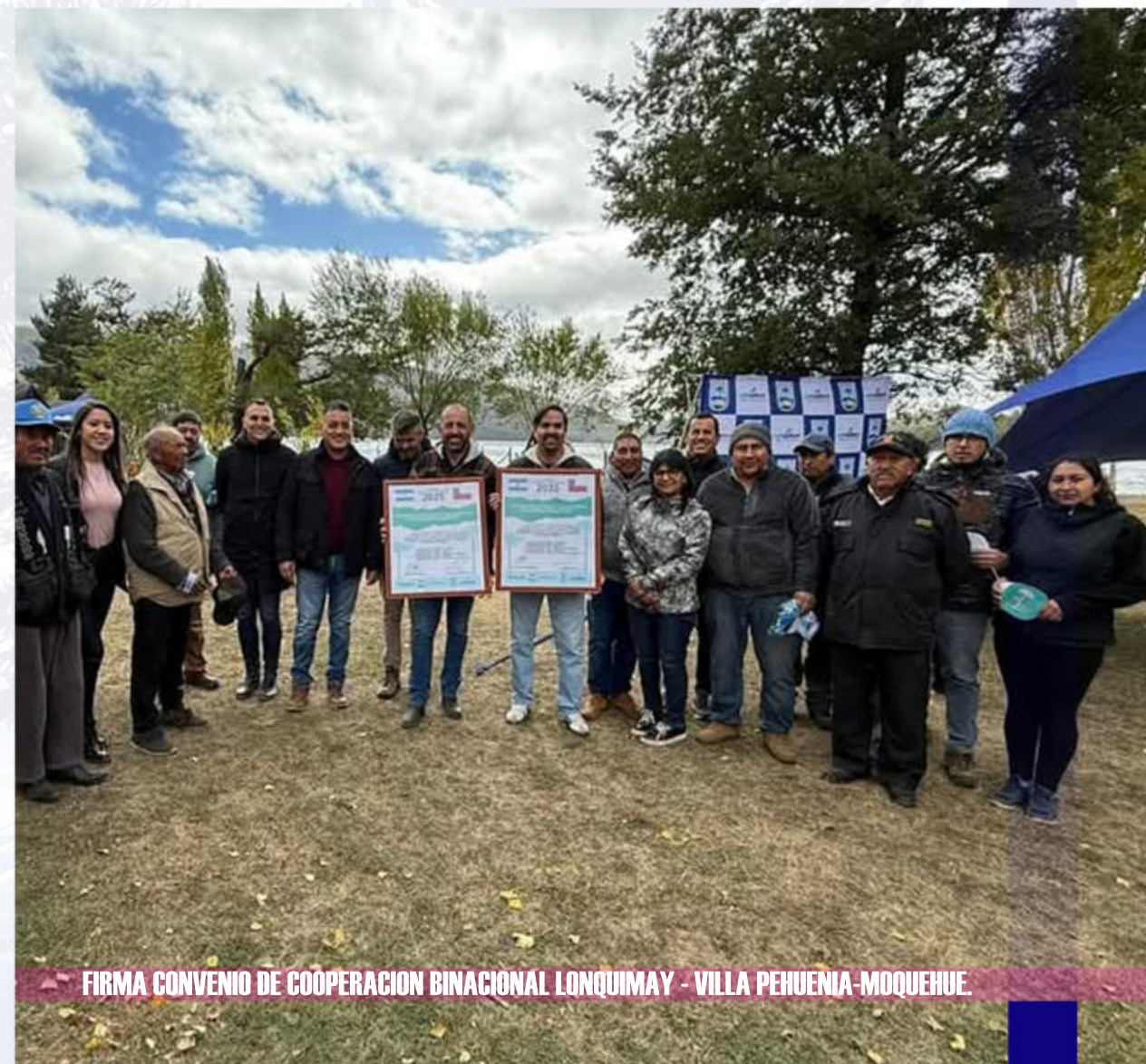
FIRMA CONVENIO DE COOPERACION BINACIONAL LONQUIMAY - VILLA PEHUENIA-MOQUEHUE

• MEJORAMIENTO DE LA ESCUELA CRUZACO, IMPLEMENTANDO UNA NUEVA SALA DE JUEGOS CERRADA PARA LOS NIÑOS Y NIÑAS DEL ESTABLECIMIENTO.