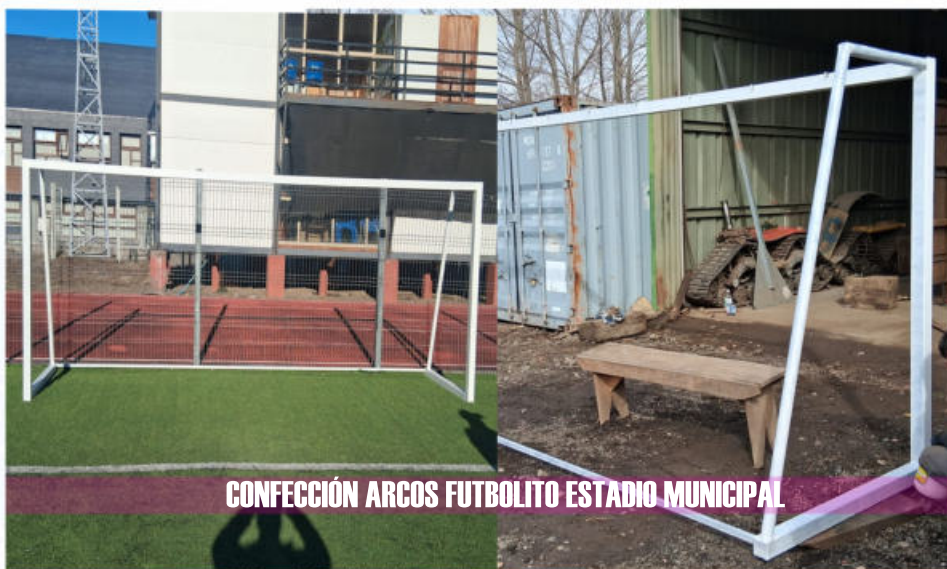
CONFECCIÓN ARCOS FUTBOLITO ESTADIO MUNICIPAL