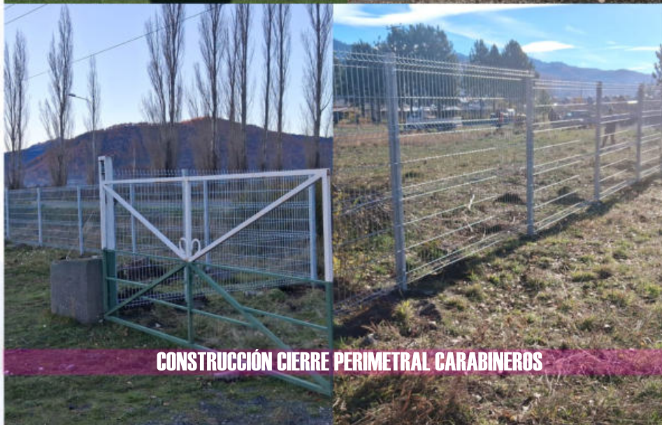
CONSTRUCCIÓN CIERRE PERIMETRAL CARABINEROS