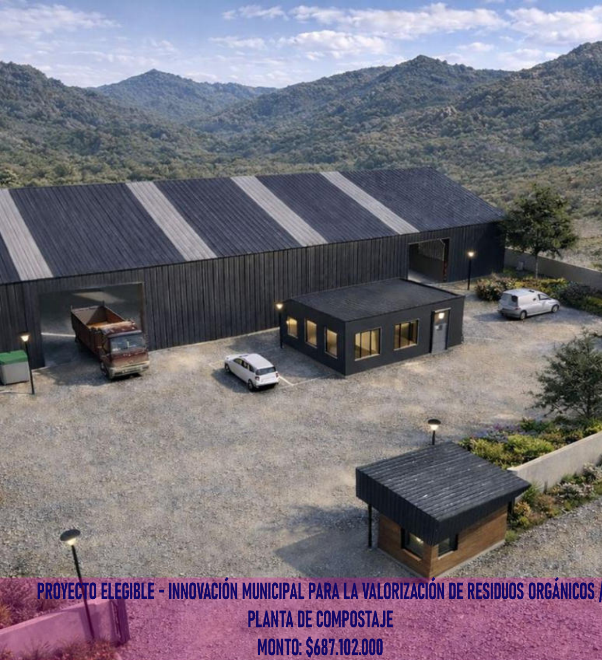
PROYECTO ELEGIBLE - INNOVACIÓN MUNICIPAL PARA LA VALORIZACIÓN DE RESIDUOS ORGÁNICOS / PLANTA DE COMPOSTAJE MONTO: $687.102.000