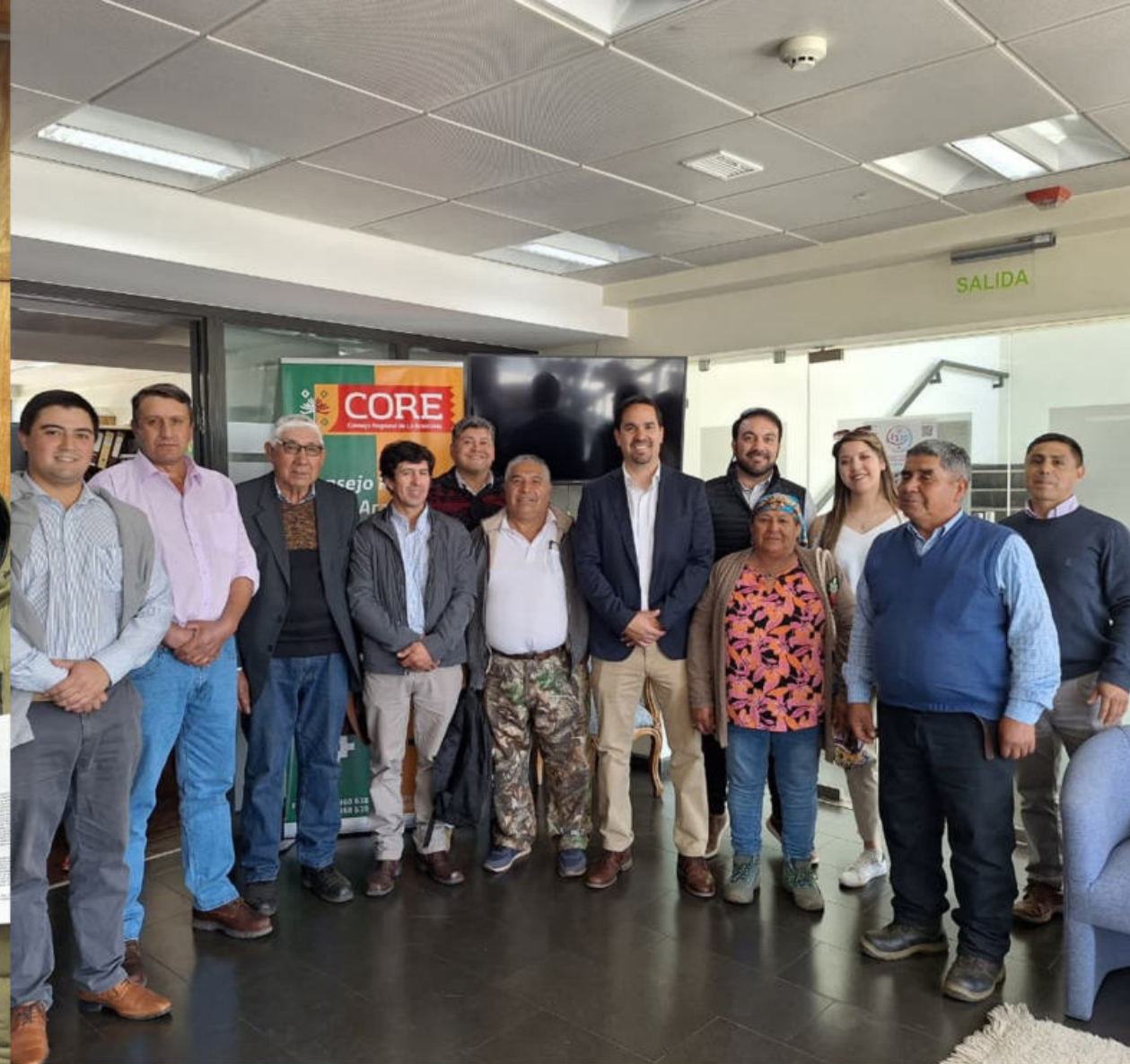
PROYECTO ELEGIBLE Y LICITADO - RECAMBIO Y AMPLIACIÓN DE LUMIANRIAS LED DIVERSOS SECTORES (LONQUIMAY, TROYO, SIERRA NEVADA, LIUCURA) MONTO: $103.039.160