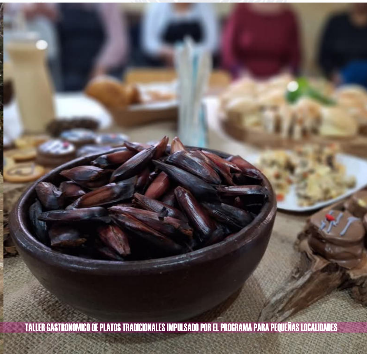
TALLER GASTRONOMICO DE PLATOS TRADICIONALES IMPULSADO POR EL PROGRAMA PARA PEQUEÑAS LOCALIDADES