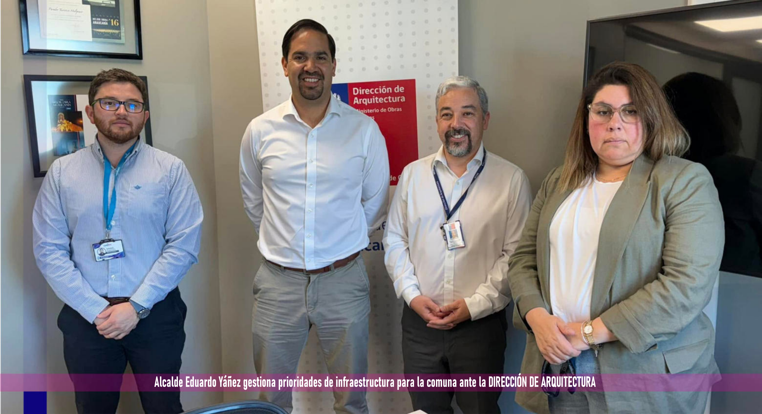
Alcalde Eduardo Yáñez gestiona prioridades de infraestructura para la comuna ante la DIRECCIÓN DE ARQUITECTURA