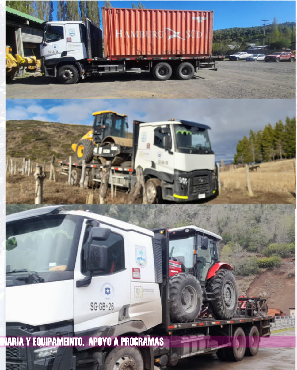
TRASLADO DE LEÑA Y FORRAJE, TRASLADO MAQUINARIA Y EQUIPAMIENTO, APOYO A PROGRAMAS