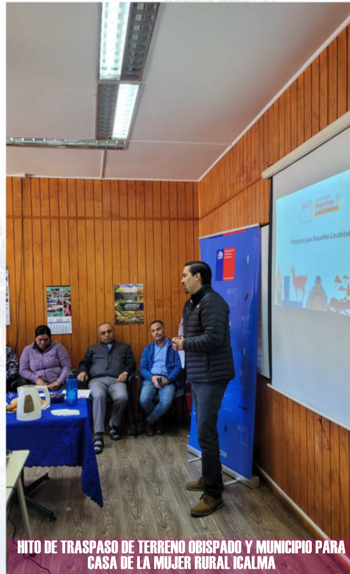
HITO DE TRASPASO DE TERRENO OBISPADO Y MUNICIPIO PARA CASA DE LA MUJER RURAL ICALMA

Para el cumplimiento de sus funciones, el Administrador Municipal podrá tener el apoyo administrativo, técnico y profesional que le asigne el Alcalde.