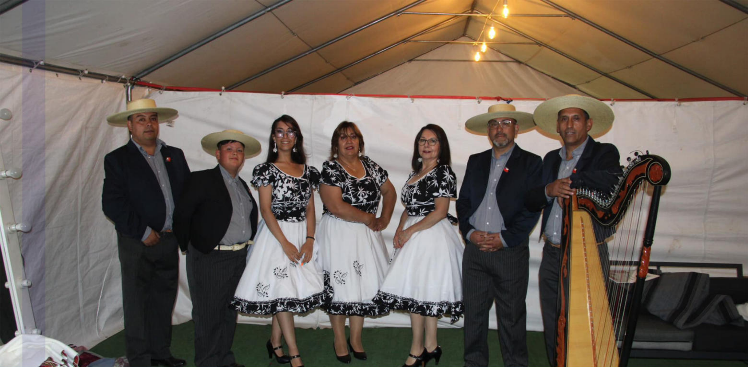
JORNADA FIESTA DEL ASADO DE CHIVO Y LAS TRADICIONES DE LONQUIMAY