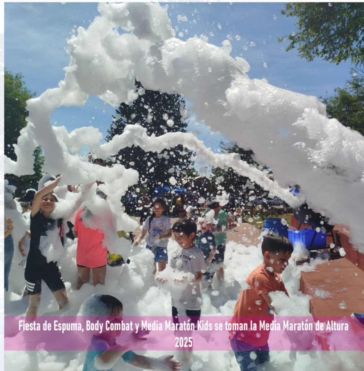
Fiesta de Espuma, Body Combat y Media Maratón Kids se toman la Media Maratón de Altura 2025

1. "Auditoría Externa Presupuestaria y Financiera del Departamento de Educación de Lonquimay"