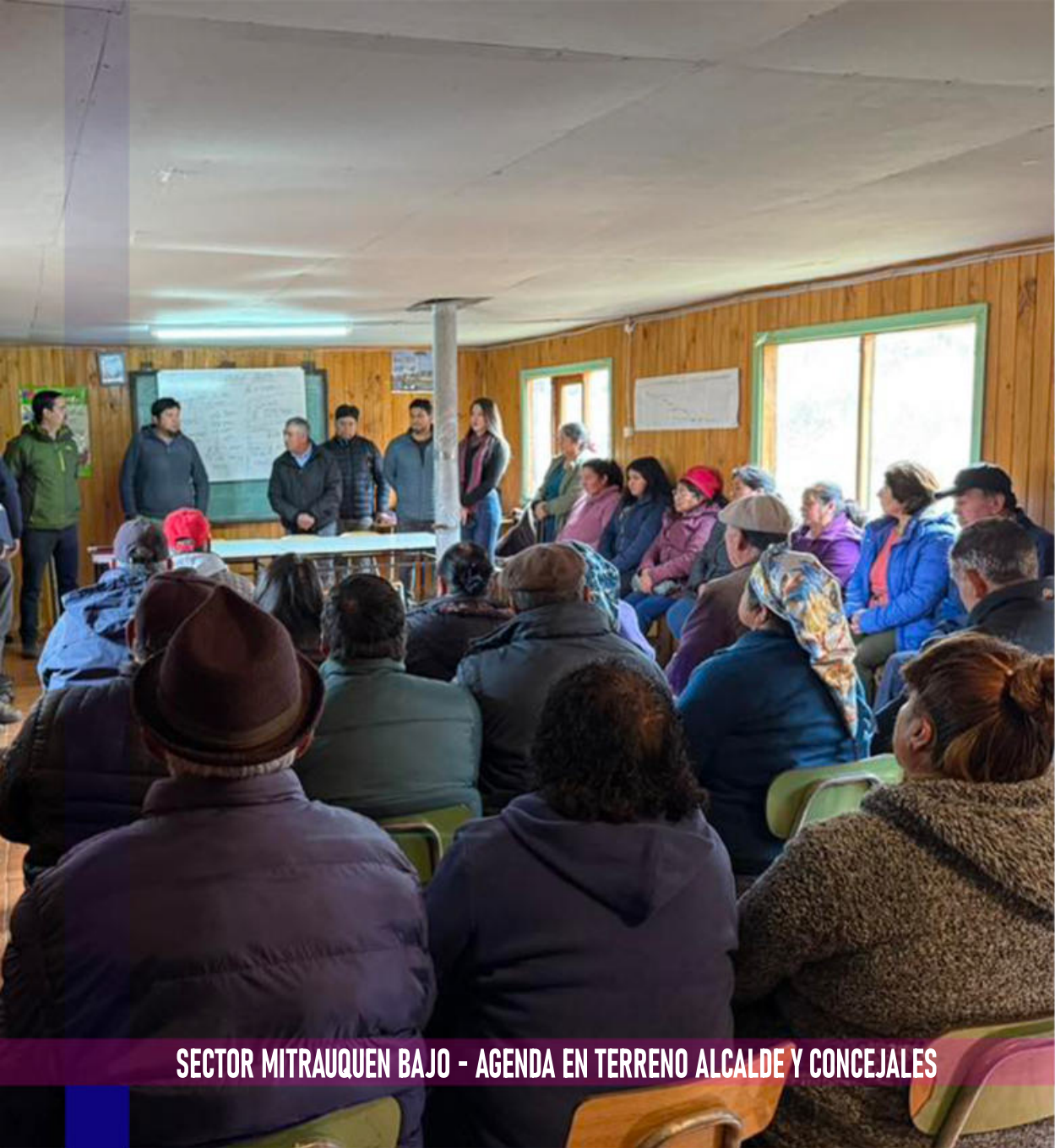
SECTOR MITRAUQUEN BAJO - AGENDA EN TERRENO ALCALDE Y CONCEJALES