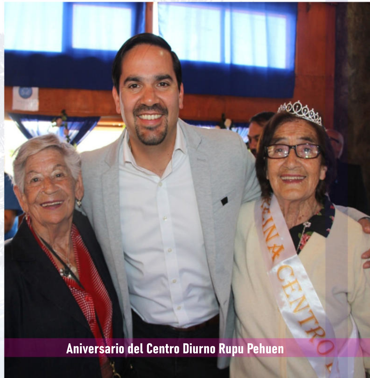
Aniversario del Centro Diurno Rupu Pehuen