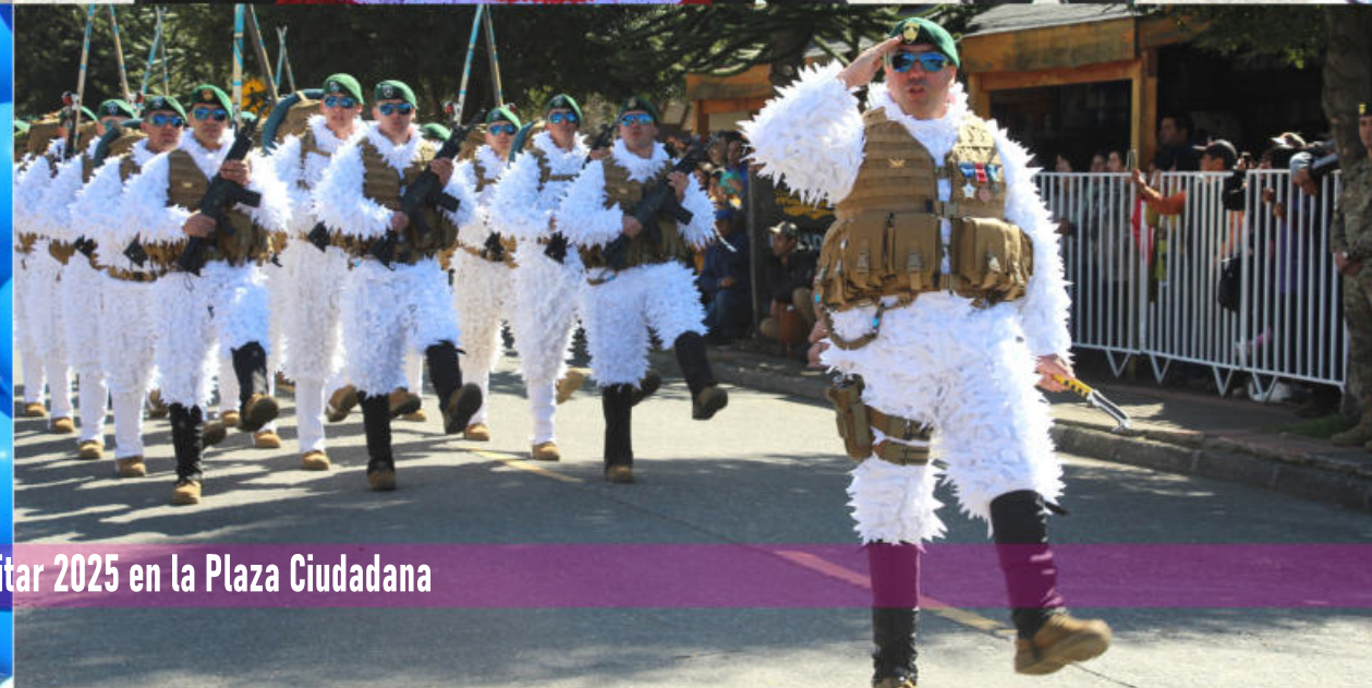
Celebración Desfile Cívico Militar 2025 en la Plaza Ciudadana