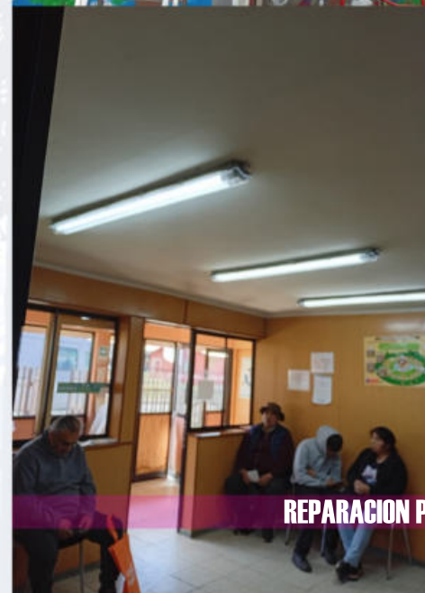
REPARACION POSTAS RURALES