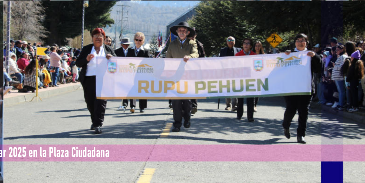
Celebración Desfile Cívico Militar 2025 en la Plaza Ciudadana