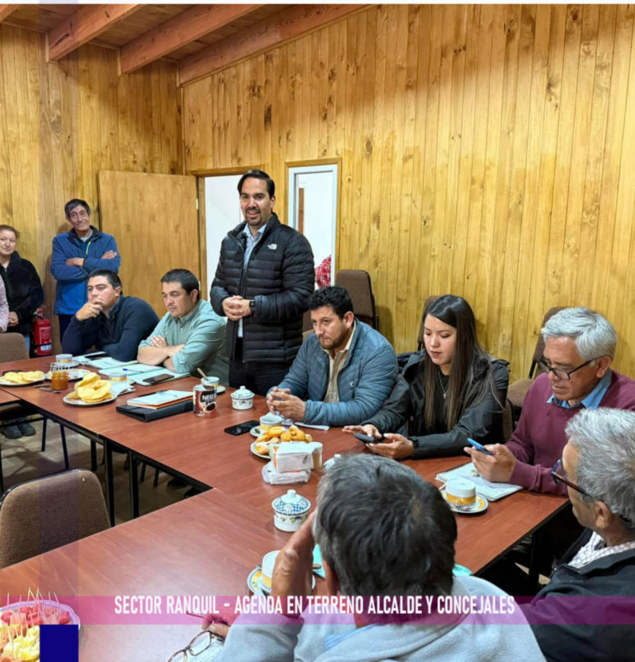
SECTOR RANQUIL - AGENDA EN TERRENO ALCALDE Y CONCEJALES