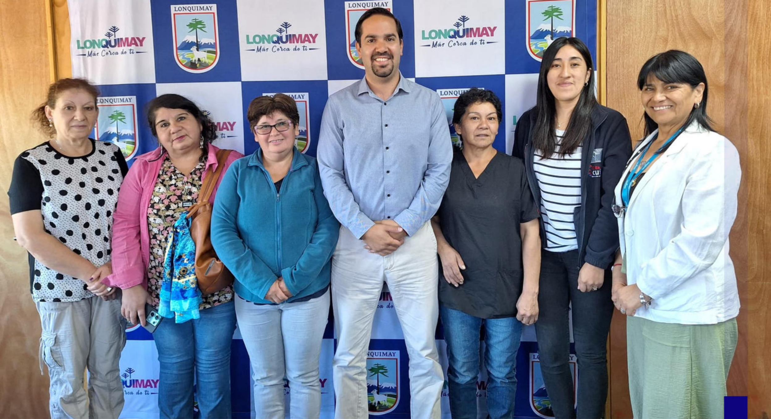
Alcalde en Reunión con la agrupación Dame Tu Mano para fortalecer apoyo a cuidadores