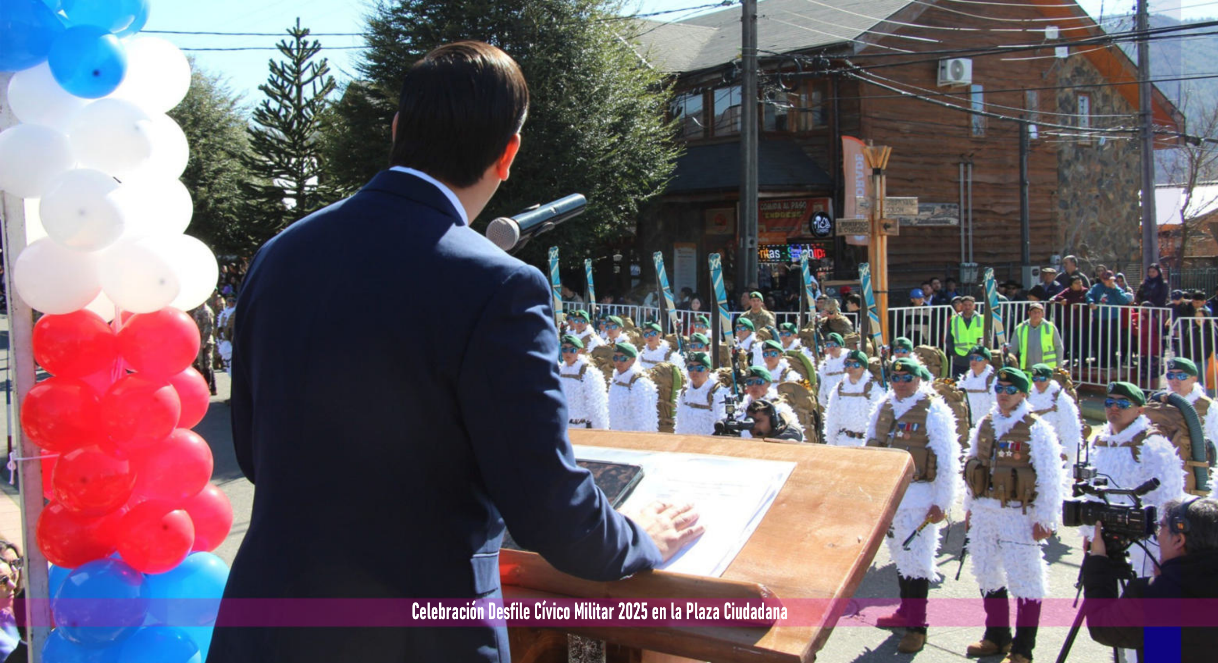
Celebración Desfile Cívico Militar 2025 en la Plaza Ciudadana