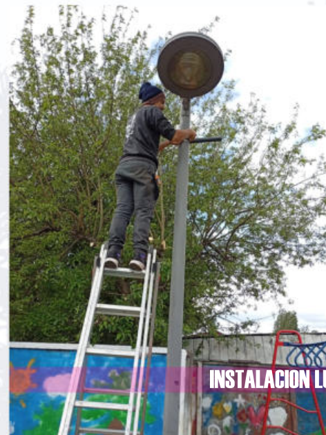
INSTALACION LUMINARIA LED