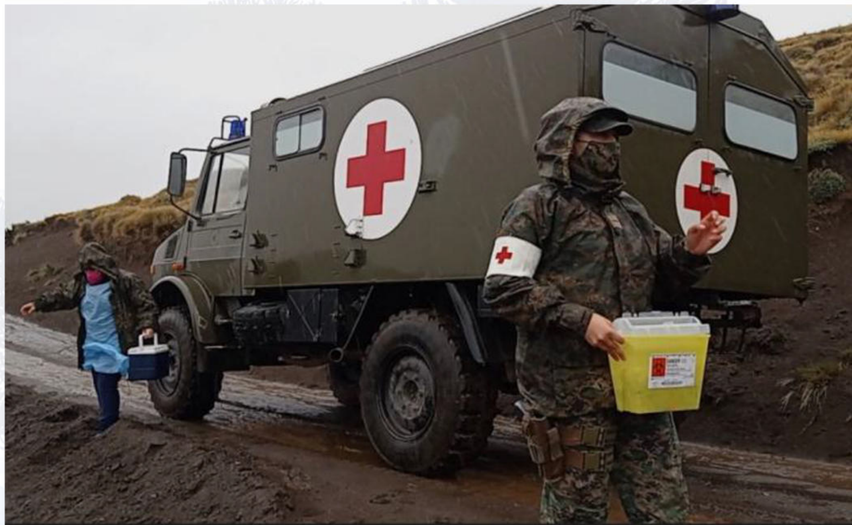
Trabajo conjunto en terreno con el intersector entre Ejército y DSM