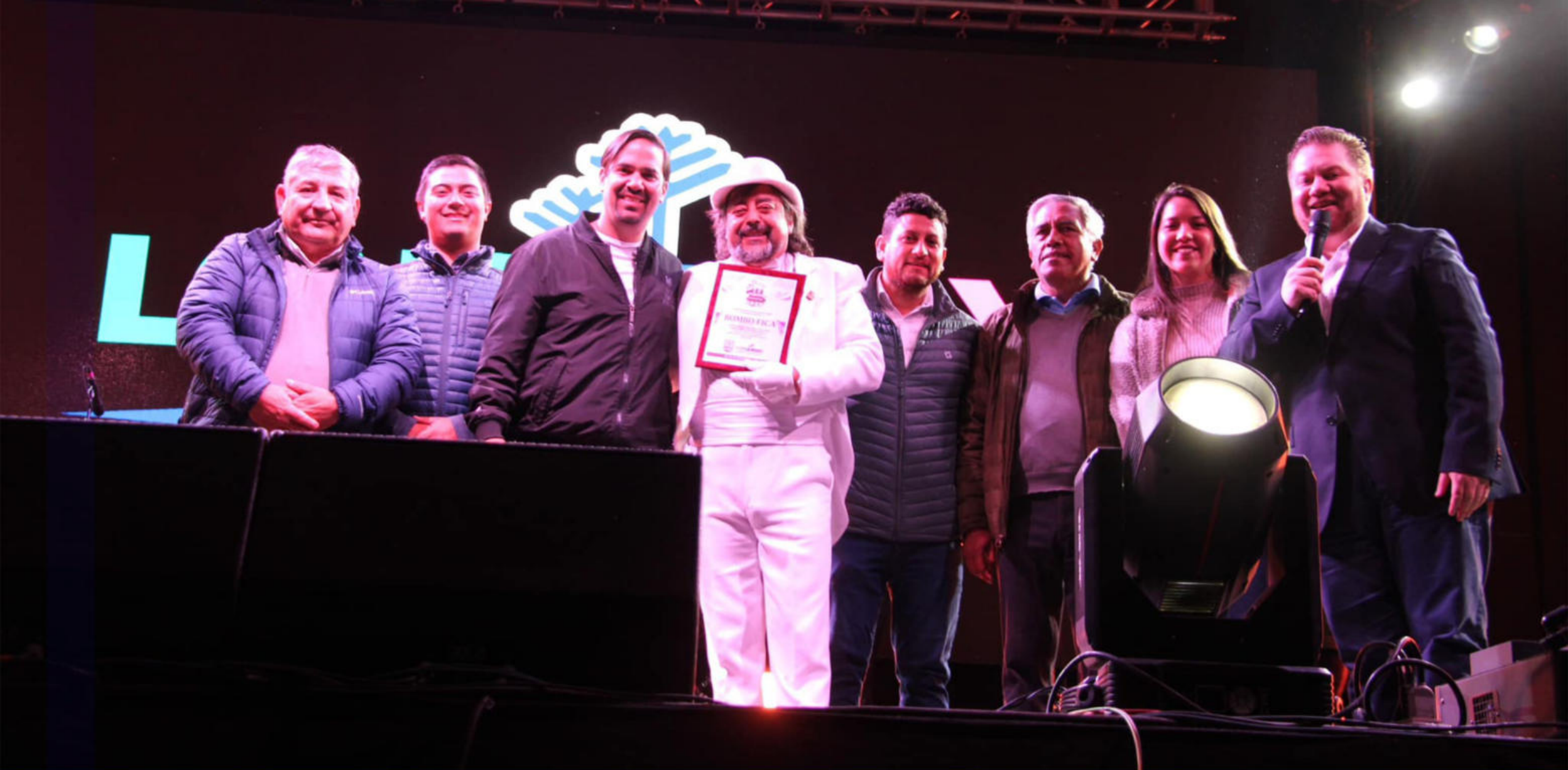
JORNADA FIESTA DEL ASADO DE CHIVO Y LAS TRADICIONES DE LONQUIMAY