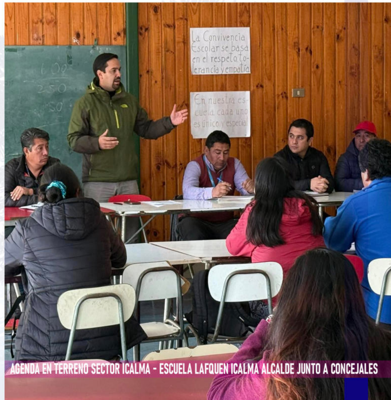
AGENDA EN TERRENO SECTOR ICALMA - ESCUELA LAFQUEN ICALMA ALCALDE JUNTO A CONCEJALES