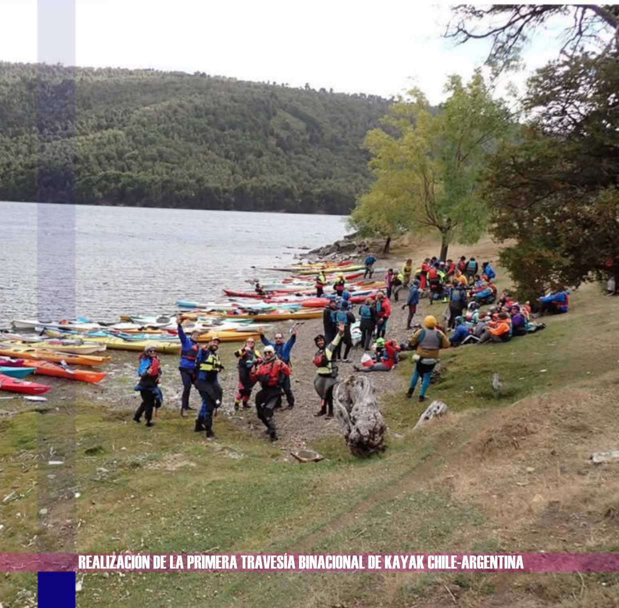
REALIZACIÓN DE LA PRIMERA TRAVESÍA BINACIONAL DE KAYAK CHILE-ARGENTINA