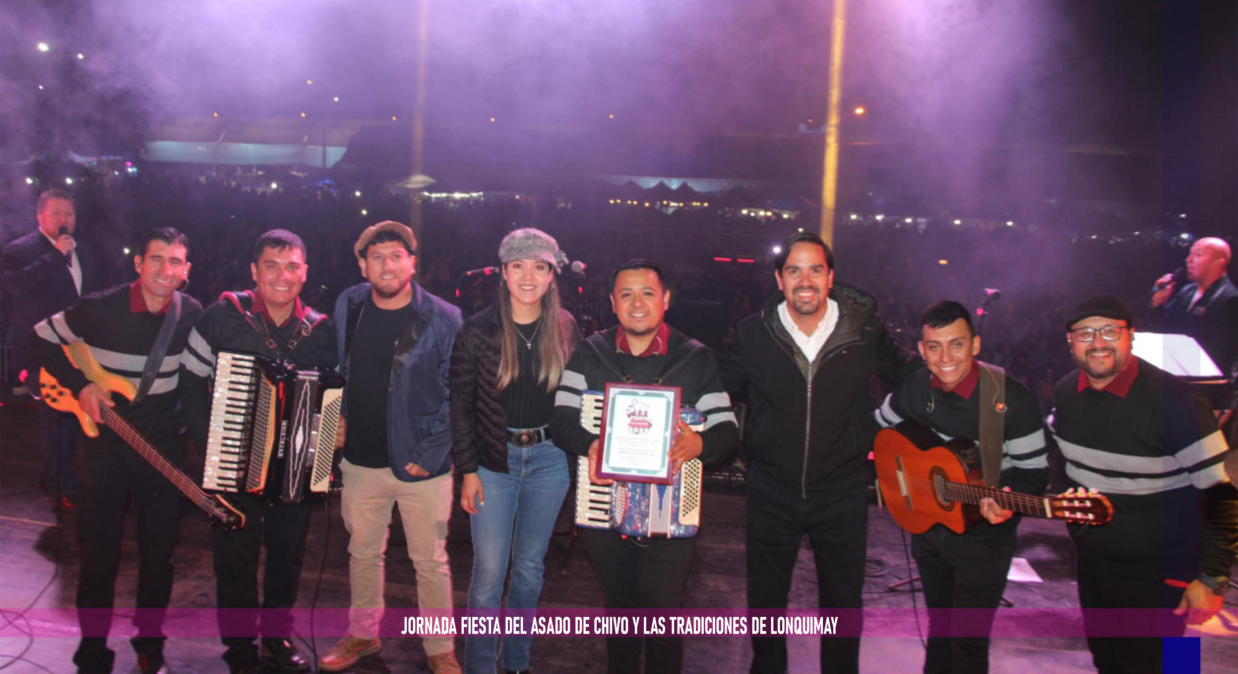
JORNADA FIESTA DEL ASADO DE CHIVO Y LAS TRADICIONES DE LONQUIMAY