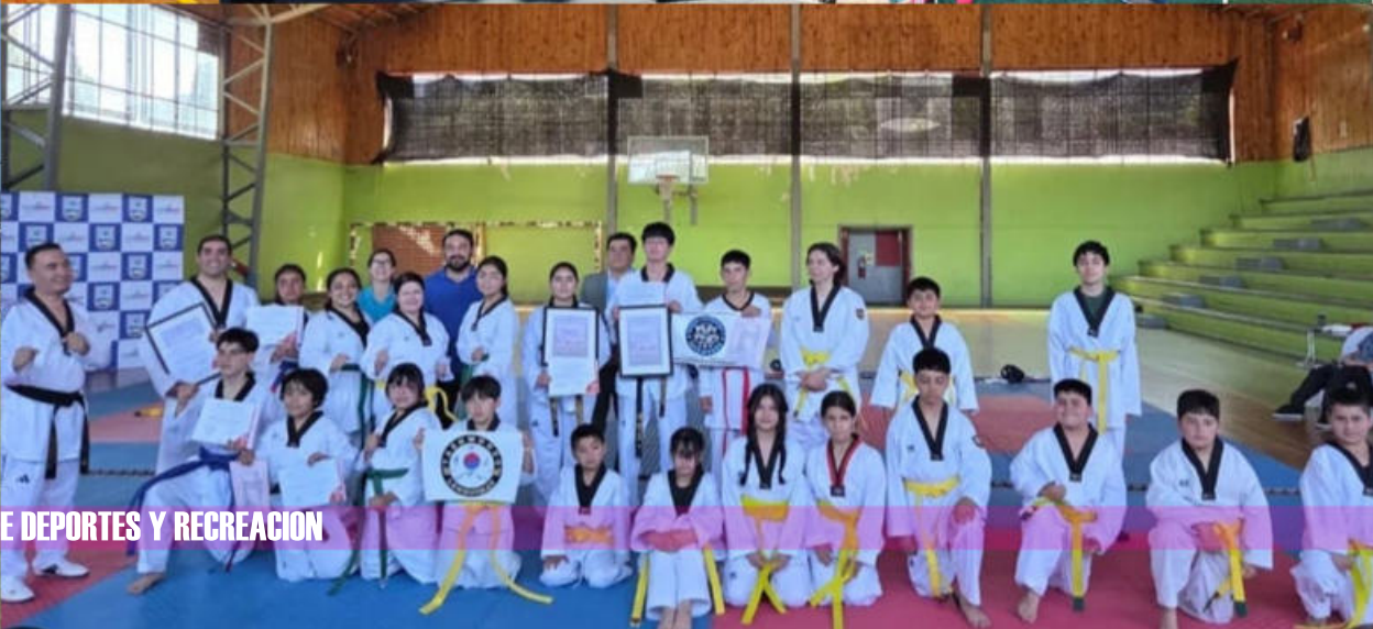
DIVERSAS ACTIVIDADES UNIDAD DE DEPORTES Y RECREACION