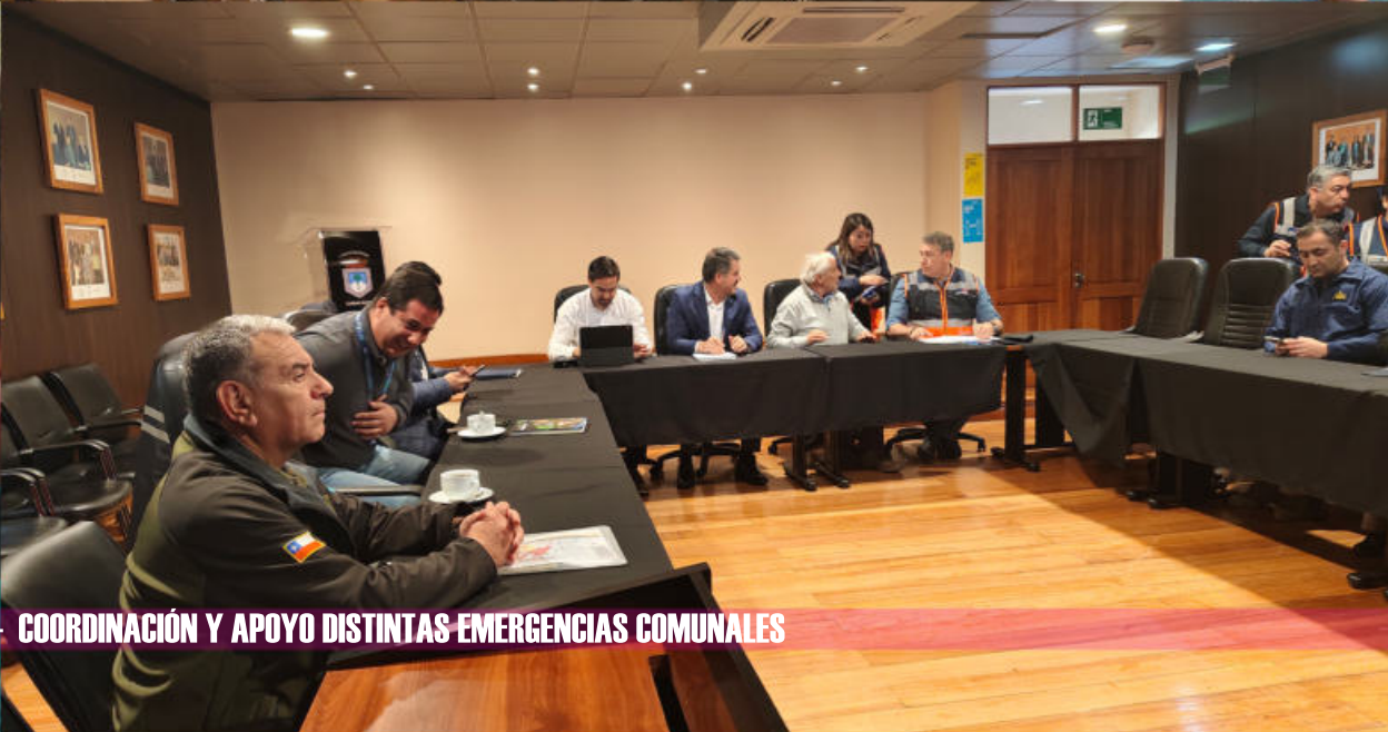
SIMULACRO ERUPCIÓN VOLCÁNICA VOLCÁN LONQUIMAY - COORDINACIÓN Y APOYO DISTINTAS EMERGENCIAS COMUNALES