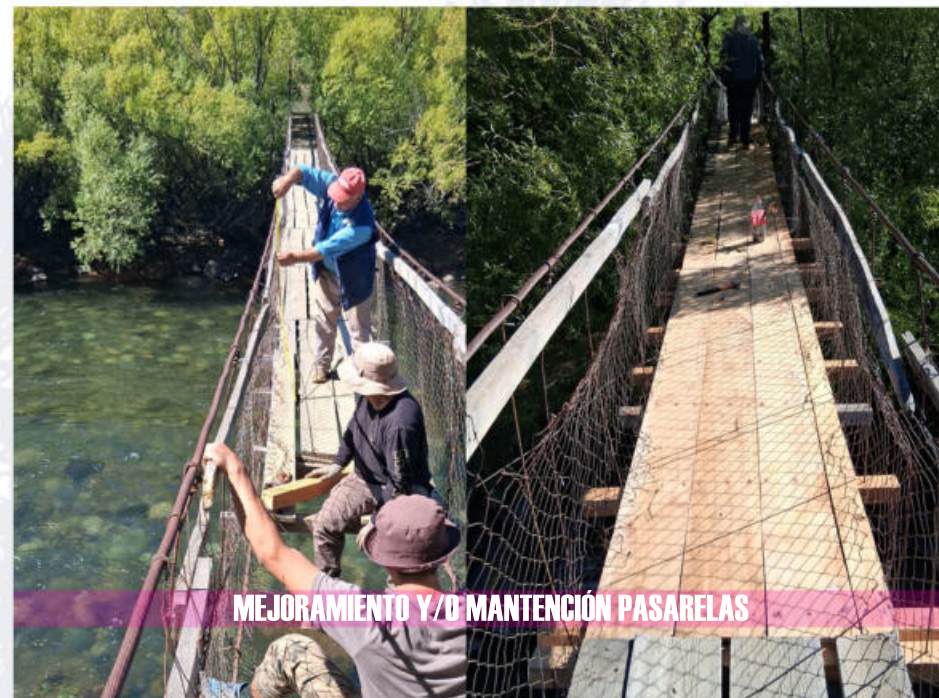
MEJORAMIENTO Y/O MANTENCIÓN PASARELAS