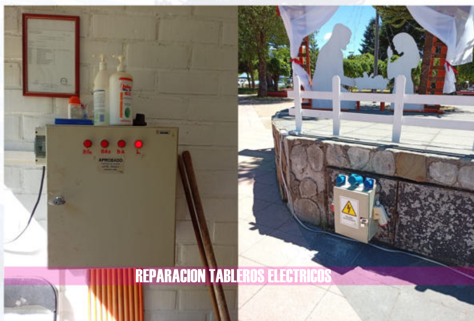
REPARACION TABLEROS ELECTRICOS