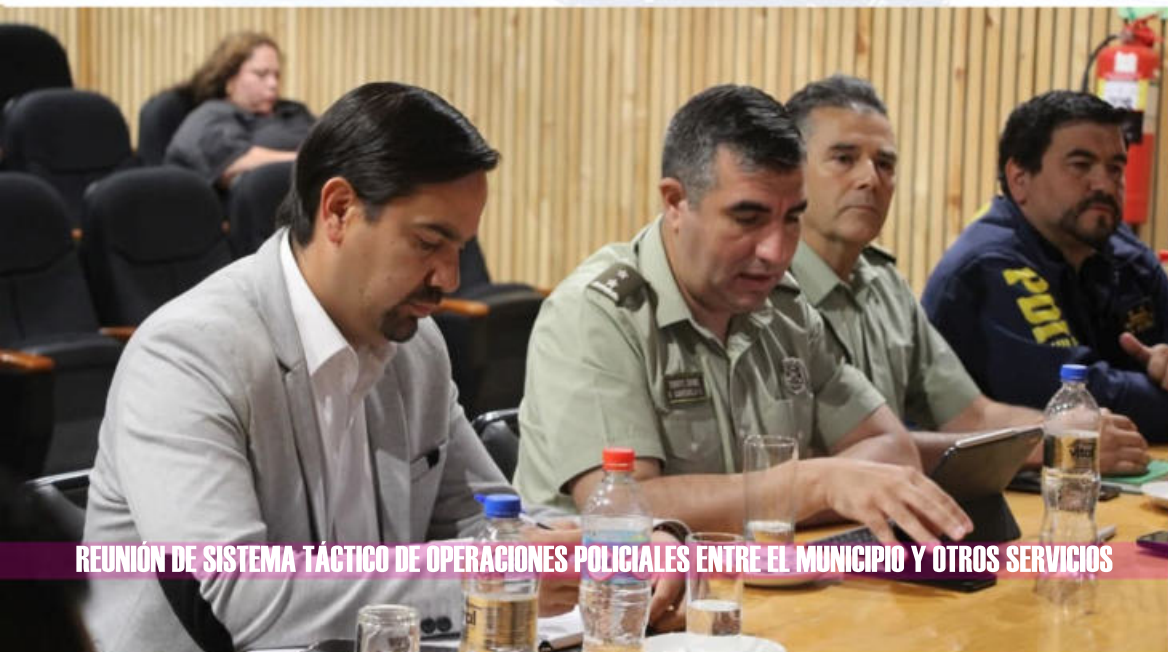
REUNIÓN DE SISTEMA TÁCTICO DE OPERACIONES POLICIALES ENTRE EL MUNICIPIO Y OTROS SERVICIOS

Organismos Integrantes Comité Seguridad Pública Comunal: Municipalidad de Lonquimay, Concejales, Gendarmería de Chile, Fiscalía Curacautín, OPD Cordillerana (Oficina de Protección de Derechos de Niños), Intendencia, Carabineros, Policía de Investigaciones (PDI), SENDA Previene (Servicio Nacional para la Prevención y Rehabilitación del Consumo de Drogas y Alcohol), Servicio Agrícola y Ganadero (SAG), Dirección de Aduanas, entre otros.