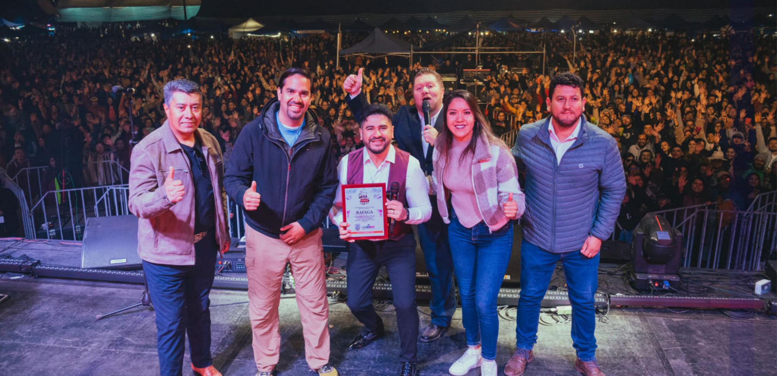
JORNADA FIESTA DEL ASADO DE CHIVO Y LAS TRADICIONES DE LONQUIMAY