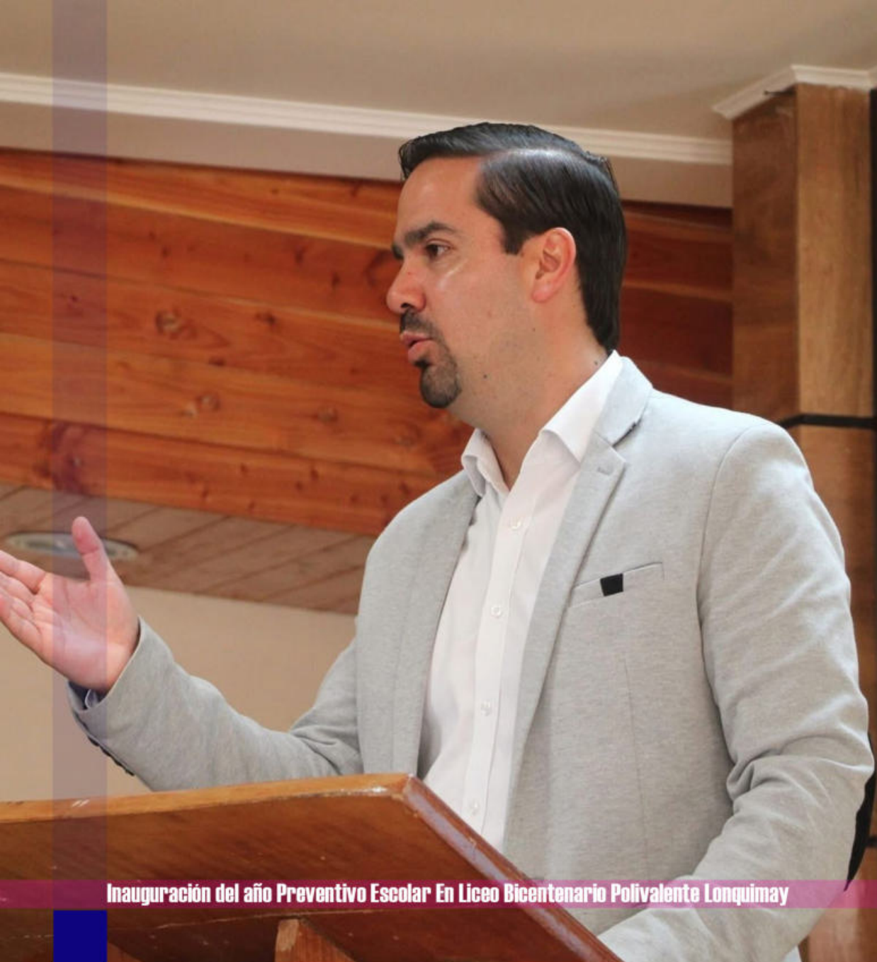
Inauguración del año Preventivo Escolar En Liceo Bicentenario Polivalente Lonquimay

La Dirección de Desarrollo Comunitario (DIDECO) tiene la misión de trabajar en post de mejorar la calidad de vida de los habitantes de la comuna, especialmente de los sectores más vulnerables de la sociedad. Asimismo, potencia y promueve la organización de las comunidades, como una forma de impulsar el desarrollo de la comuna. En este sentido las organizaciones tienen la posibilidad de ejecutar programas y proyectos de acuerdo a las necesidades que ellos quieren satisfacer, ya sea del área social, deportes y/o recreación, seguridad, entre otros.