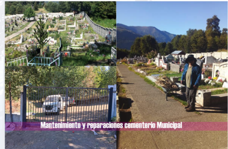
Mantenimiento y reparaciones cementerio Municipal