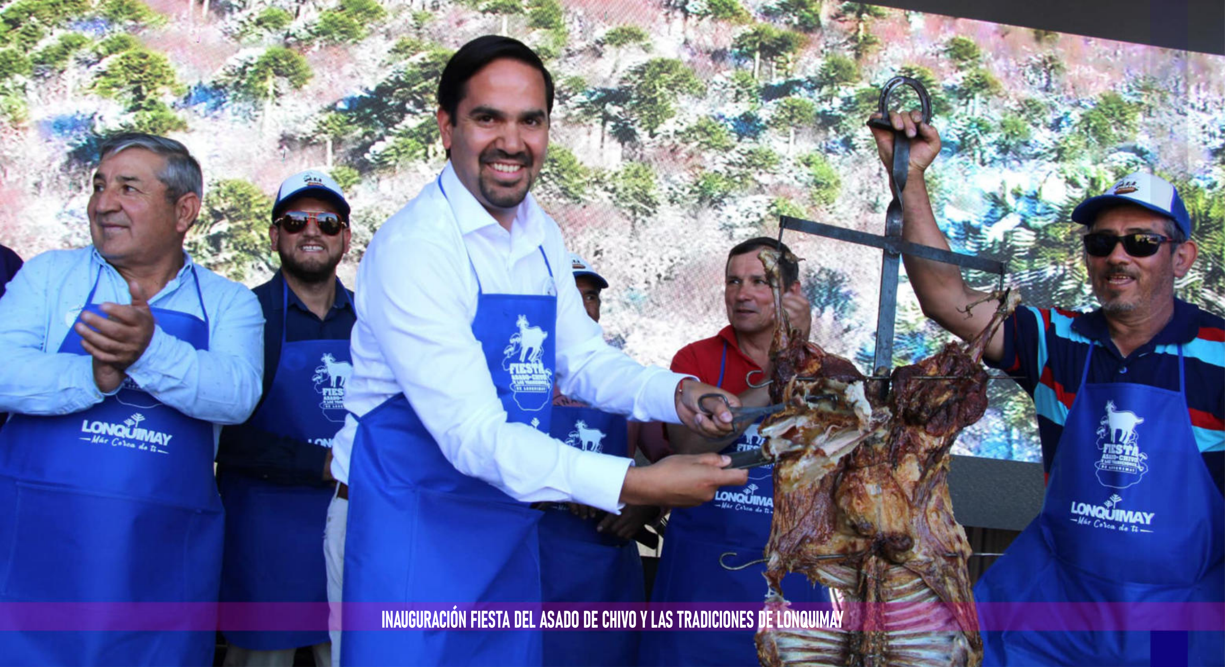
INAUGURACIÓN FIESTA DEL ASADO DE CHIVO Y LAS TRADICIONES DE LONQUIMAY