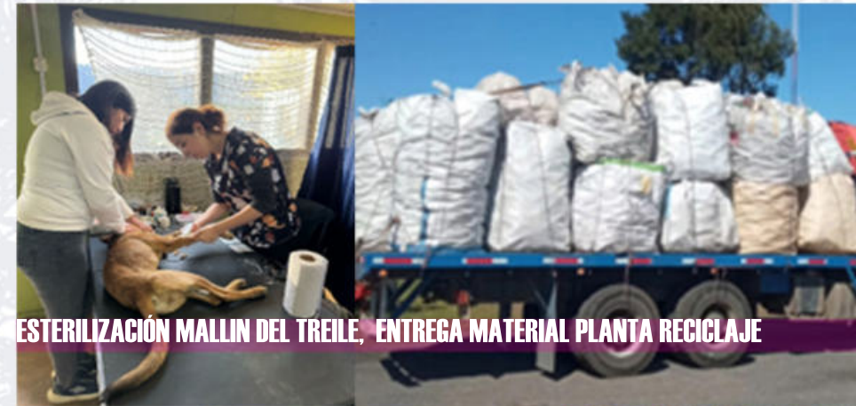
ESTERILIZACIÓN MALLIN DEL TREILE, ENTREGA MATERIAL PLANTA RECICLAJE