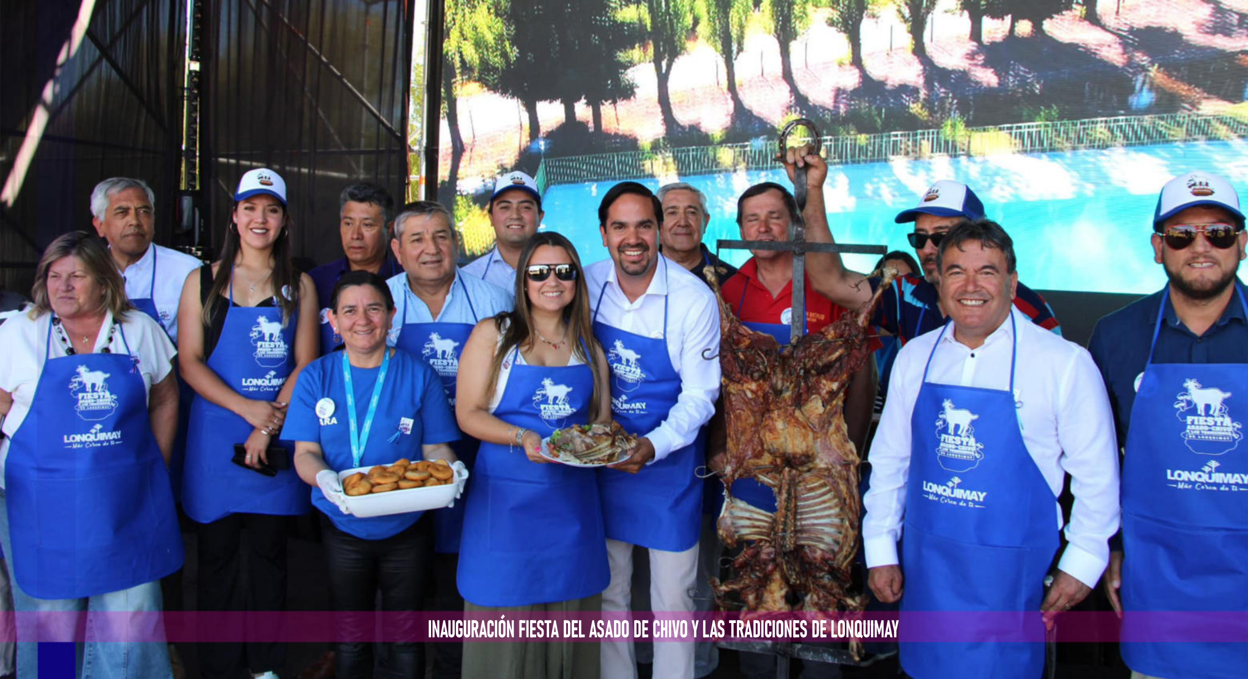
INAUGURACIÓN FIESTA DEL ASADO DE CHIVO Y LAS TRADICIONES DE LONQUIMAY