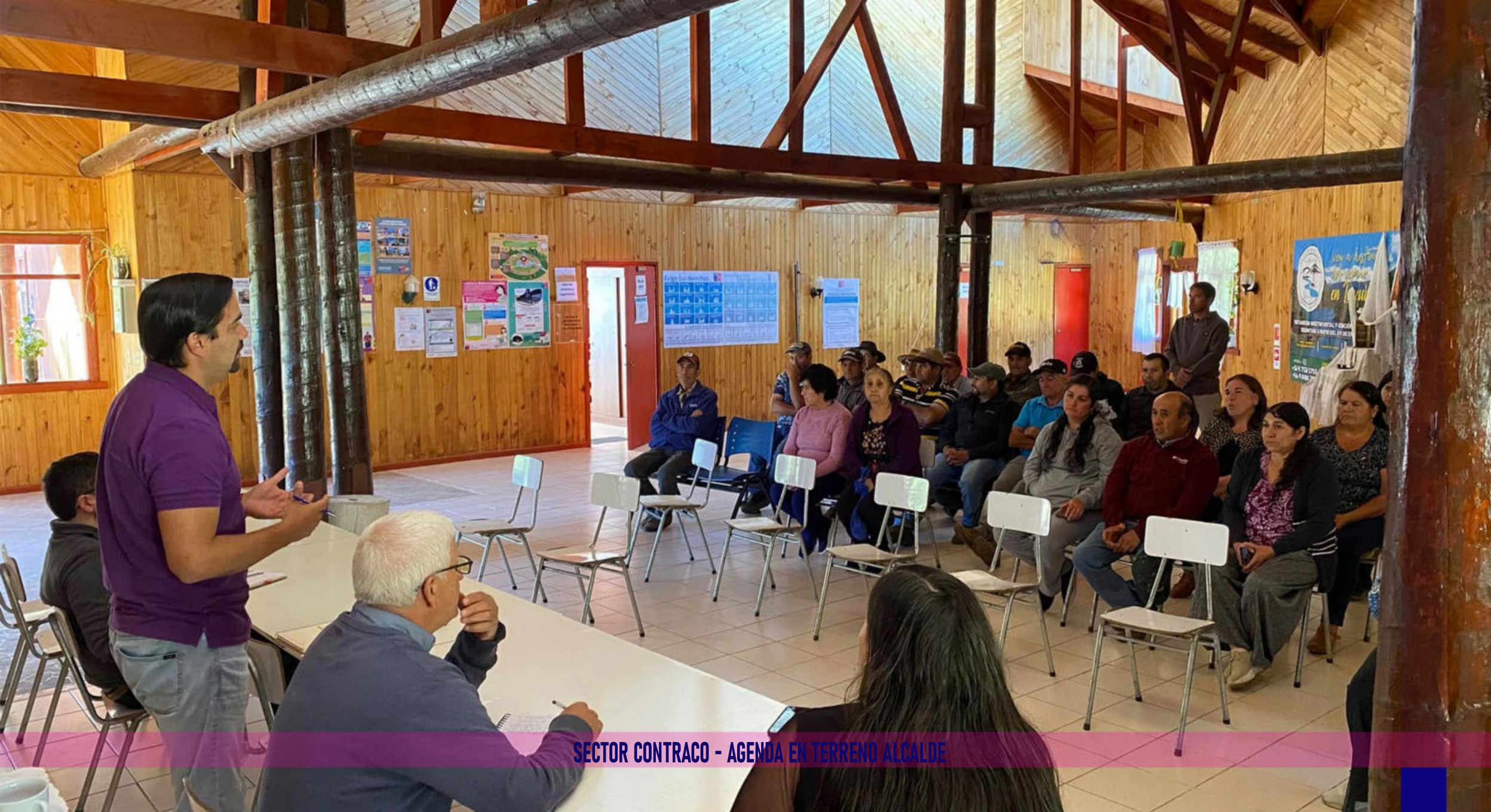
SECTOR CONTRACO - AGENDA EN TERRENO ALCALDE