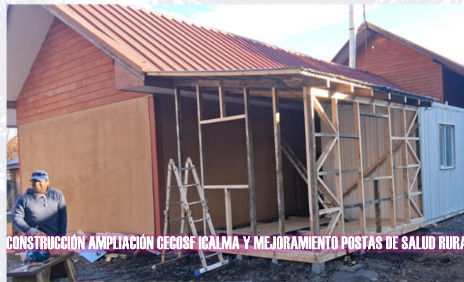
CONSTRUCCIÓN AMPLIACIÓN CECOSF ICALMA Y MEJORAMIENTO POSTAS DE SALUD RURAL