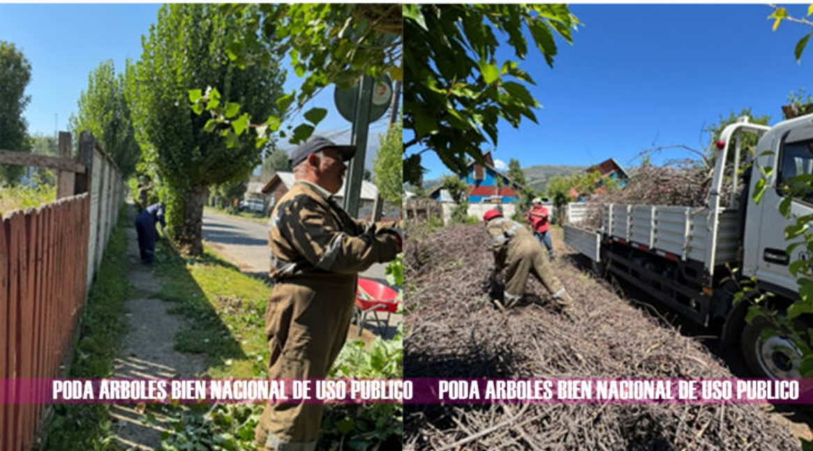
PODA ARBOLES BIEN NACIONAL DE USO PUBLICO PODA ARBOLES BIEN NACIONAL DE USO PUBLICO