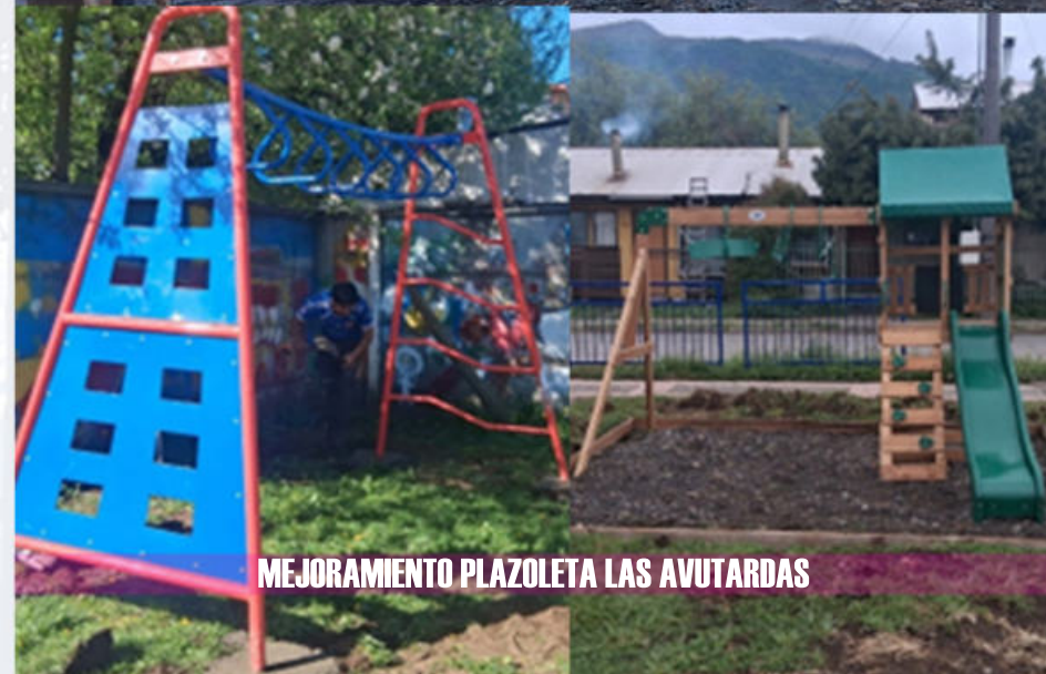
MEJORAMIENTO PLAZOLETA LAS AVUTARDAS