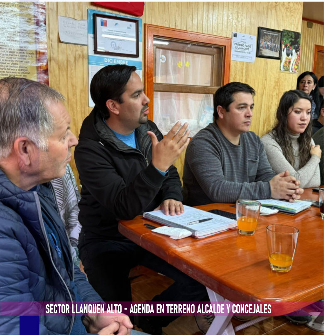
SECTOR LLANQUEN ALTO - AGENDA EN TERRENO ALCALDE Y CONCEJALES