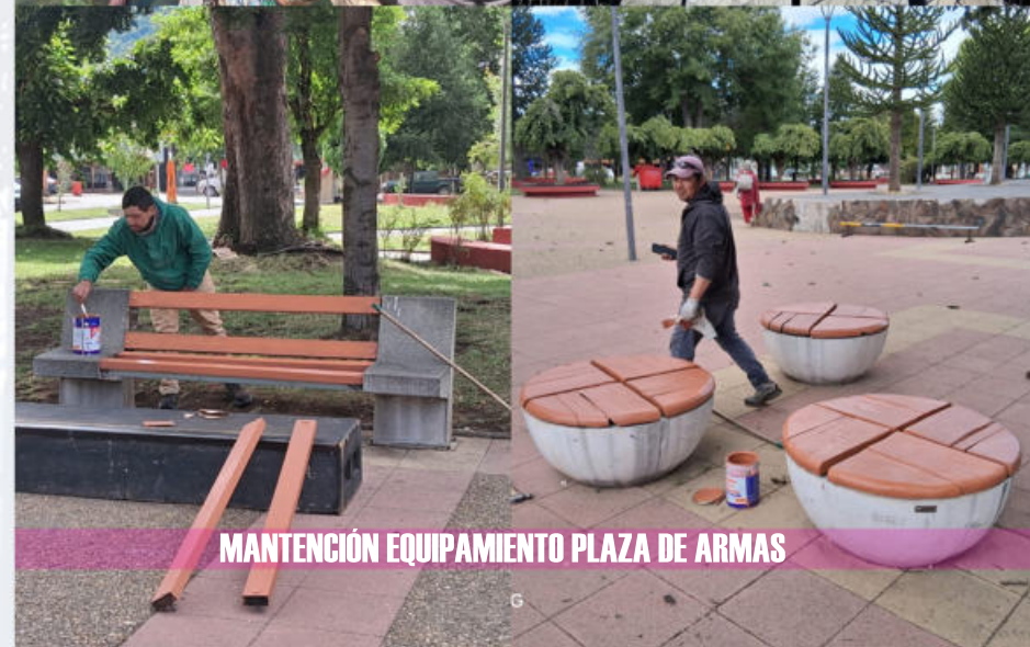
MANTENCIÓN EQUIPAMIENTO PLAZA DE ARMAS