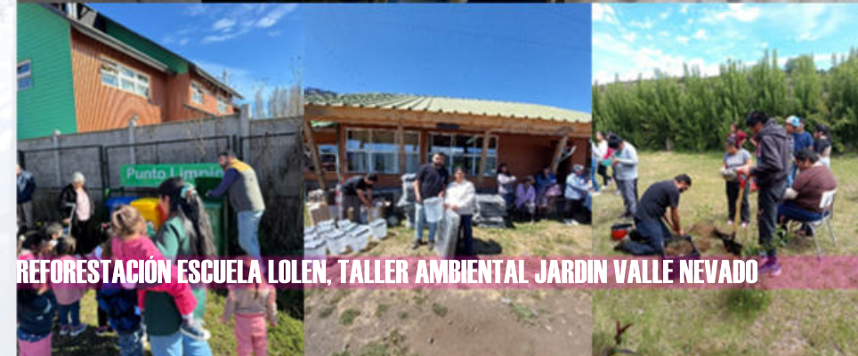
REFORESTACIÓN ESCUELA LOLEN, TALLER AMBIENTAL JARDIN VALLE NEVADO