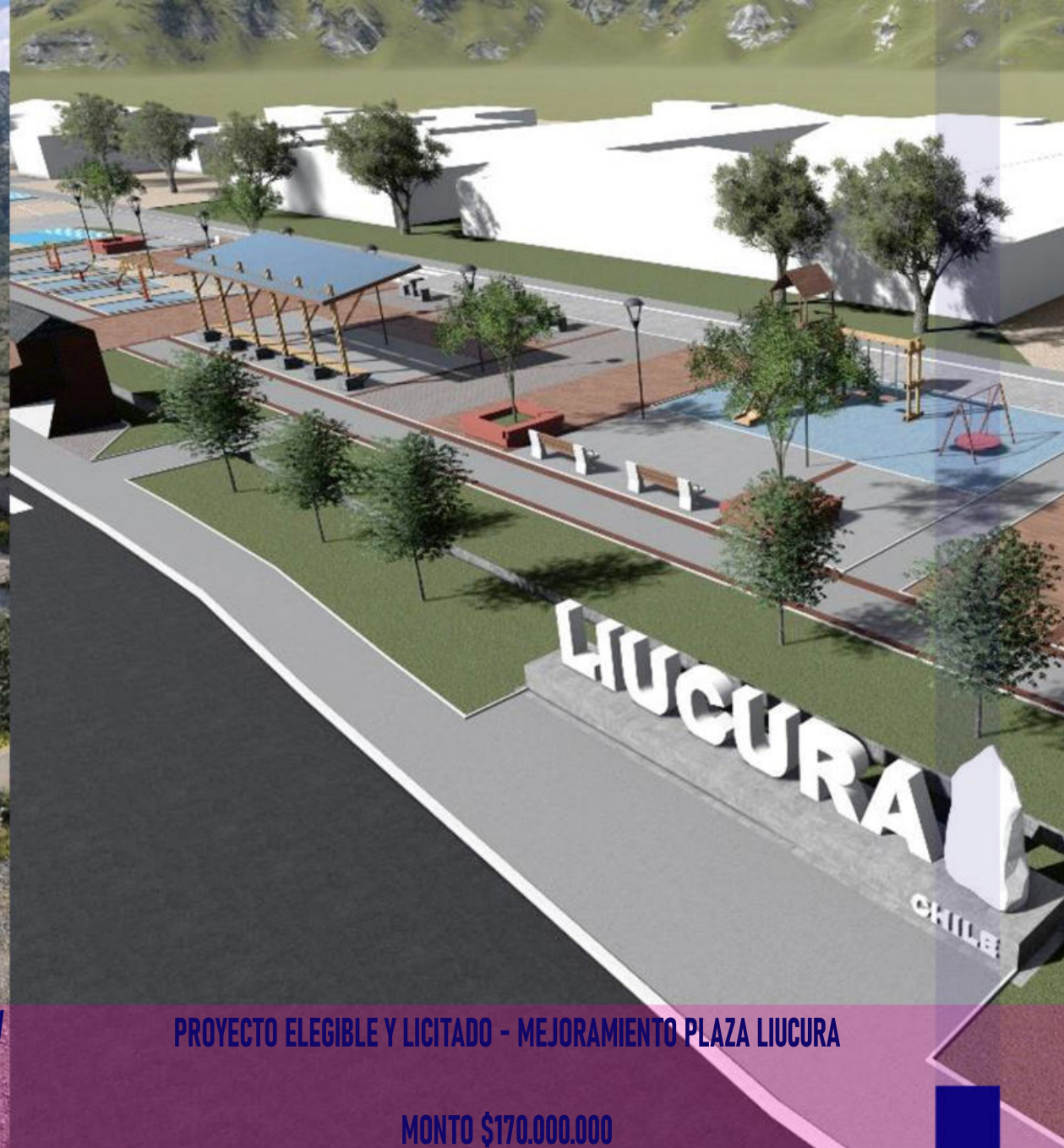
PROYECTO ELEGIBLE Y LICITADO - MEJORAMIENTO PLAZA LIUCURA MONTO $170.000.000