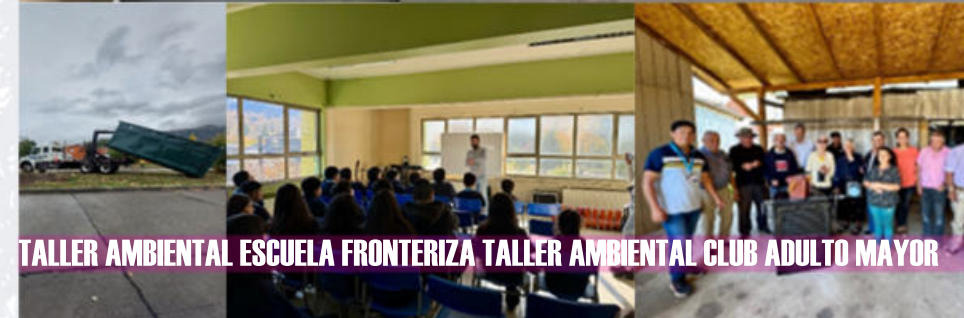
TALLER AMBIENTAL ESCUELA FRONTERIZA TALLER AMBIENTAL CLUB ADULTO MAYOR